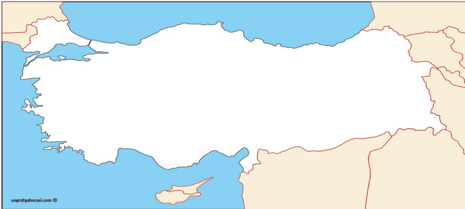
TÜRKİYE'NİN KOMŞULARI DİLSİZ HARİTASI